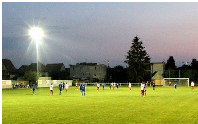
Futbalový zápas pod umelým osvetlením