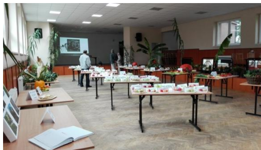
Výstava Farmárska revue - interiér

V dňoch 26. a 27. septembra sa v kultúrnom dome a okolitých priestoroch uskutočnil ďalší ročník Farmárskej revue - spoločnej výstavy alekšinských chovateľov a záhradkárov. Na tejto výstave boli prezentované ukážky domácich zvierat - králikov a hydiny, ako aj ukážky ovocia, zeleniny a kvetov, ale aj záhrad, v ktorých sa tieto plodiny dopestovali. Je smutným faktom, že záujem o výstavu zo strany vystavovateľov i návštevníkov je z roka na rok menší.