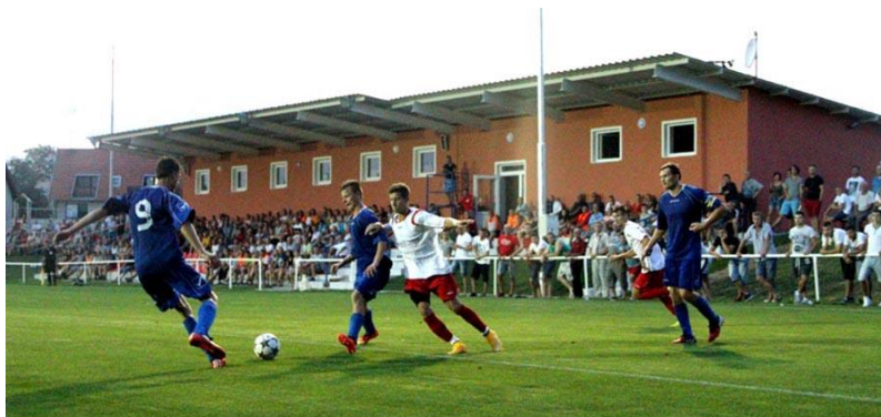
Divácka kulisa na futbalovom zápase