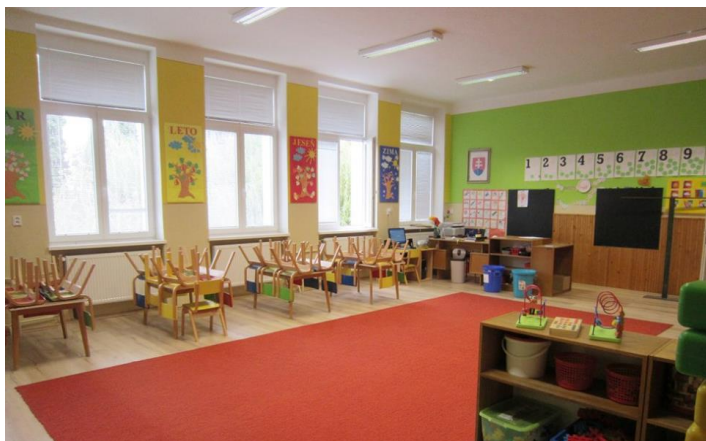
Materská škola po rekonštrukcii

aSc rozvrhy. V našej základnej škole sa uskutočnilo 25. novembra 2015 premiérové celoštátne testovanie piatakov T5-2015 zo slovenského jazyka a matematiky. Najväčšou investičnou akciou však bola druhá a zároveň finálna fáza rekonštrukcie sociálnych zariadení na druhom