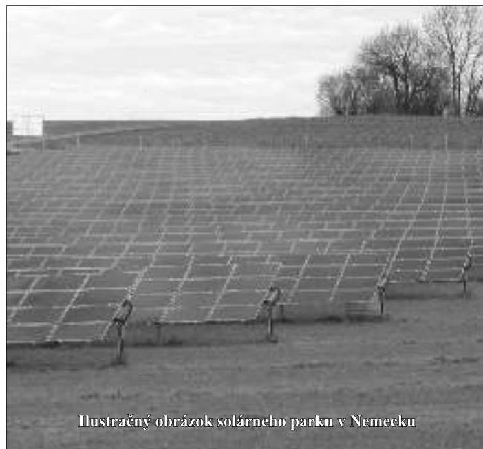
Ilustračný obrázok solárneho parku v Nemecku

Jablone si môžete prevziať dňa 09. 04. 2010 t.j v piatok o 18 .00 hodine pri Kultúrnom dome.