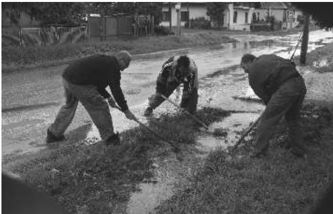
Zatápaný Žomboch - zväčšovanie prietoknosti prícestného rigola

V roku 2009 bola vypracovaná a podaná žiadosť na MV RR SR-regionálny operačný program, spolufinancovaná z Európskeho fondu regionálneho rozvoja pod názvom Zatraktívnenie centra obce, v celkovej výške 653 712 € z čoho 5% je vlastná povinná spoluúčasť. Žiadosť bola vyhodnotená ako úspešná a v súčasnosti prebieha výberové konanie na dodávateľa stavby. Projekt rieši ulice Kostolná, Školská a Hlavná, ktoré ohraničujú centrum obce. Na týchto uliciach sa majú budovať nové chodníky, parkovacie miesta a rekonštruovať komunikácie. Nový chodník sa má budovať i k obecnému úradu, kde budú tiež vybudované parkovacie miesta. Drevená budova bývalej knižnice sa odstráni a na jej mieste sa vytvorí zóna na stretávanie občanov. V parku za obecným úradom vybudujeme parkové chodníky a bude zrealizovaná výsadba. Nad miestnym potokom Andač vybudujeme novú lávku pre peších. V dôsledku daných skutočností realizujeme druhú etapu kanalizácie na týchto uliciach: