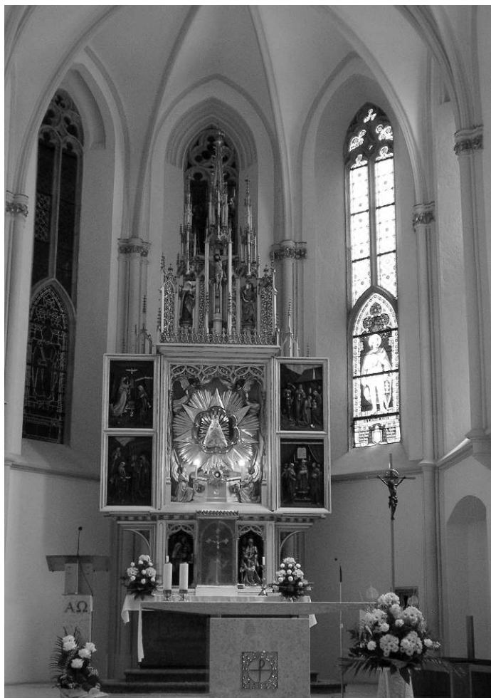
Neogotický hlavný oltár baziliky v Marianke (s pôvodnou soškou Panny Márie a Ježiška z hruskového dreva)