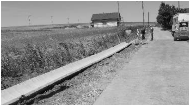
Tehelná ulica - budovanie záchytného rigola

V minulom čísle obecných novín som vás informoval, že je úspešne zrealizovaný vrt novej studne s hĺbkou 170 m. V súčasnosti máme i výsledky komplexných rozborov vody. Všetky sledované ukazovatele, ktorých je 112 sú v norme, iba mangán vykazuje zvýšené koncentrácie. Voda v novej studni vykazuje lepšie fyzikálne a chemické vlastnosti ako zo studne, ktorú v súčasnosti používame. Podľa odborného