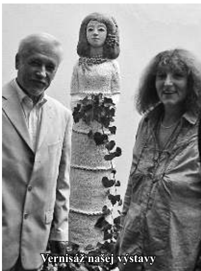
Vernisáž našej výstavy