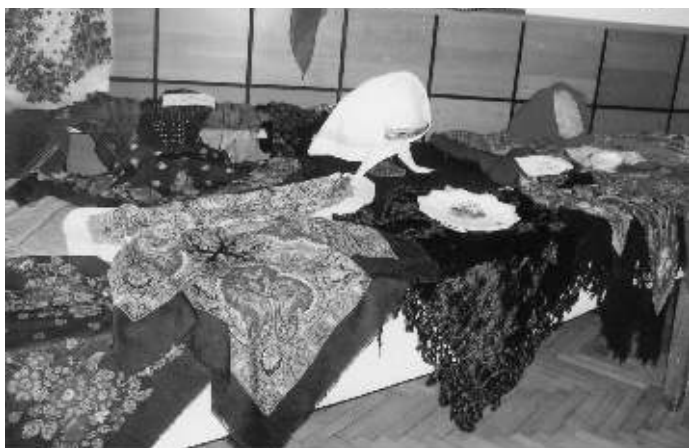
Pri príležitosti VČS si dôchodcovia urobili peknú výstavu šatiek