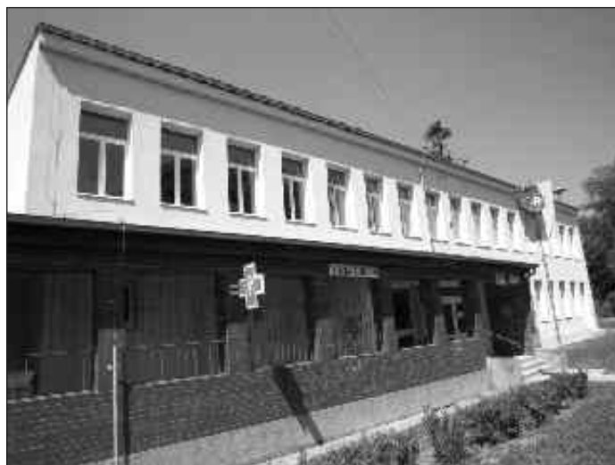
Budova OcÚ po ukončení energetického projektu

Vyzývam všetkých vlastníkov výjazdových mostíkov, prietokov pod nimi a priestranstiev pred svojimi domami aby si tieto pravidelne čistili, udržiavali ich a tak zabezpečili čo najlepšie odtekanie vody.