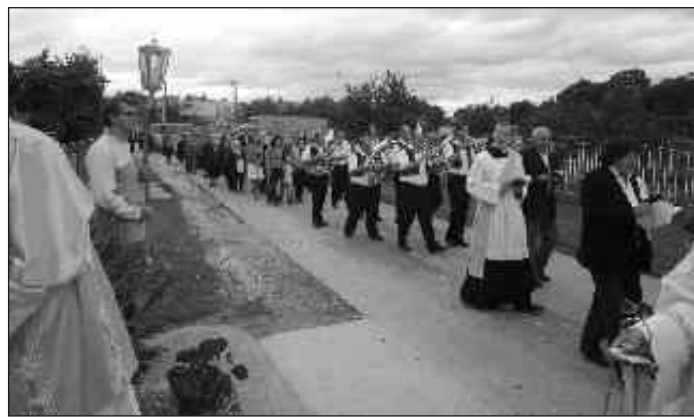
Bídičkovy sprievod i tento rok doplnila dychová hudba zo Šulekova