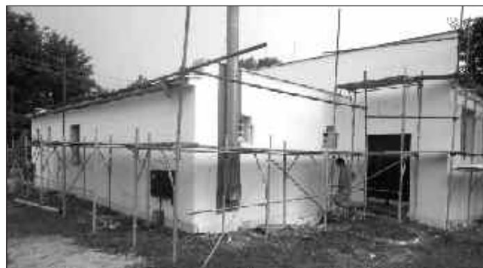
Kultúrny dom v rekonštrukcii

V projekte LEADER obec Aleksince ako člen Mikroregiónu Radošinka bola úspešná v žiadosti o rekonštrukciu budovy kultúrneho domu. V rámci rekonštrukcie sa v interiery zhotoví nový strop, uloží sa časť novej dlažby, po obvodných múroch sa zrealizuje nový obklad, obnoví sa čelo javiska. Na vonkajšej časti kultúrneho domu sa osadia nové okná, zateplí sa celá budova a zároveň sa zrealizuje nová fasáda. Víťazom verejného obstarávania sa stala firma MOLDA s.r.o. z Nových