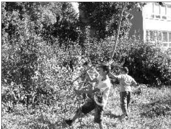
Žiaci ZŠ sa vlastnou prácou pričiňujú o skrášlenie okolia školy.