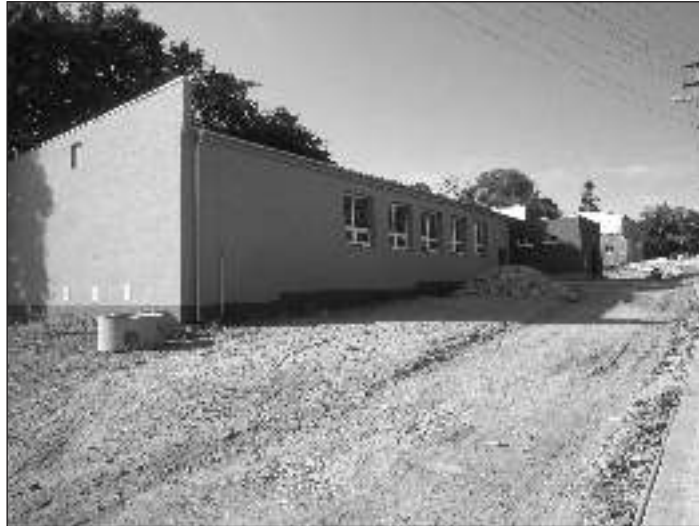
Rekonštrukcia kultúrneho domu je ukončená. V súčasnosti prebieha výstavba prístupovej komunikácie, chodníkov, spevnených plôch a parkovej výsadby v okolí obecného úradu a v centre obce.

Avizovaný europrojekt "Revitalizácia centra obce Alekšince" sa začal realizovať. V súčasnosti sú vybudované chodníky pred ZŠ a v okolí