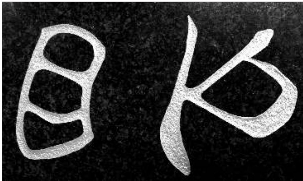
Obr.č.1: Znaky z kamennej doštičky, ktorá bola nájdená v obci Alekšince.

Vidiecke sídla vznikali pri cestách, na križovatkách, pri prameňoch, pri vodných tokoch, pod hradiskami, pri pastvinách a boli determinované prírodnými zdrojmi. Obce si vytvárali vzájomné ekonomické i sociálne väzby, ako aj pocit spolupatričnosti, navzájom sa podporovali pri výstavbe, v rozvoji a mali blízku kultúru. Vidiek charakterizuje súlad s prírodou a regionalita, čo je určitá znakovosť typická pre dané územie. Táto znakovosť sa odvíja od kultúrnych tradícií, spôsobu života, dostupných materiálov, duchovnej i sociálnej úrovne človeka. Život vidiečanov tradične charakterizovala pokora, úprimnosť, úcta, morálne hodnoty, zmysel a vzťah človeka k človeku. Vidiečan bol kedysi jednoducho vidiečan, to bola jeho identita, jeho život, jeho poslanie, ktoré mu prinášalo na jednej strane tvrdú prácu a na druhej strane slobodu, samostatnosť, hrdosť a obživu. Vidiek bol pre človeka žijúceho v meste zaujímavý, príjemný, dobrodružný, zdravý a najmä iný, pretože mal od mesta odlišné črty, prvky, identitu, ktorú vidiečan svojim spôsobom