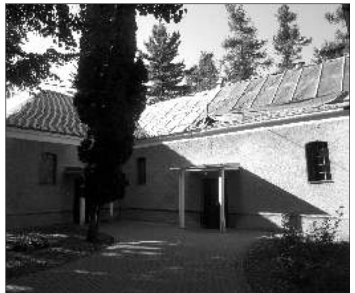
Oprava strechy kostola je v druhej fáze. Jej ukončenie bude v októbri 2011.