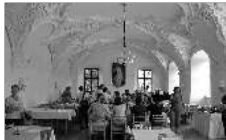
Nové Hrady - návšteva kláštora spojená s malým občerstvením

Na výstave „Země živitelka“ sa manažérka spolu s predsedníčkou našej MAS stretli so zástupcami MAS Podlipansko z Českej republiky a dohodli sa na spolupráci prostredníctvom spoločného projektu v rámci opatrenia 4.2. Vykonávanie projektov spolupráce.