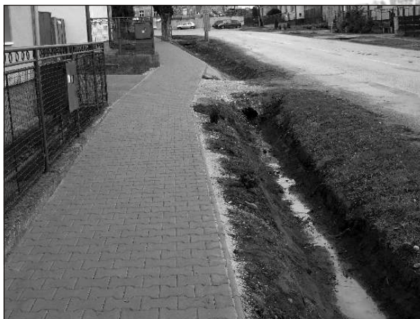
Nový chodník ku kostolu z projektu Revitalizácia centra obce Alekšince v spolupráci s RSÚC Nitra prehlbený pricestný rigol

Mariánskej púte a rôznych výletov. Všetky tieto úspechy sú odrazom kvality práce výborov a predsedov organizácií. Vytvárajú základný predpoklad pre bohatý kultúrno-spoločenský a športový život v našej obci. Každá nová myšlienka a dobrý nápad sú vítané. Je na nás, ako sa o seba postaráme, ako budeme zveľaďovať náš život.