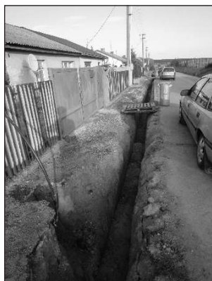
Vodovod na Lahniach

opäť je tu koniec roka. Prichodí nám čas bilancovať. Aký teda bol rok 2011? Napriek skutočnosti, že prebieha celosvetová kríza, ako starosta Alekšincov konštatujem, že pre nás to bol rok výborný. Pripomeniem, že v tomto roku sme zrekonštruovali obecný úrad, kultúrny dom, z europrojektu „Revitalizácia centra obce Alekšince“ je zrealizovaných asi 80%. To sú akcie, o ktorých sme písali i v predchádzajúcich číslach obecných novín a ktoré ste mali všetci možnosť sledovať, realizovali sa totiž priamo v srdci obce.