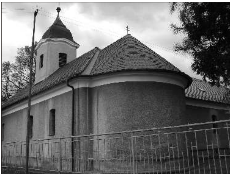
Zrekonštruovaná strecha Alekšinského kostola