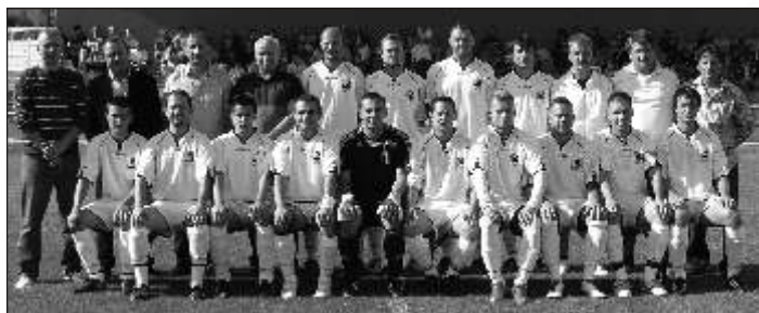
A. mužstvo Alekšince