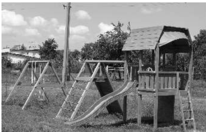
Nové detské ihrisko Materskej školy

Dovoľte, aby som Vám na záver môjho príhovoru zaželel veľa zdravia, príjemné dovolenky, žiakom a študentom vydarené prázdniny, teplú vodu, dni plné slnka a radosti a šťastný návrat do školských lavíc.