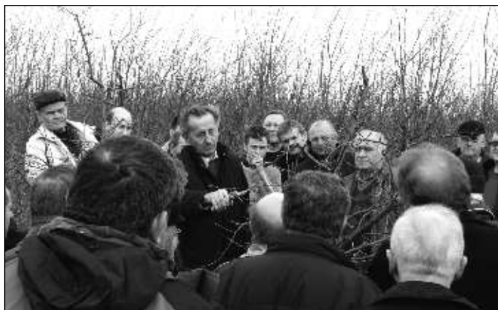
Praktické ukážky rezu stromčekov v Lukáčovciach 9.3.2013