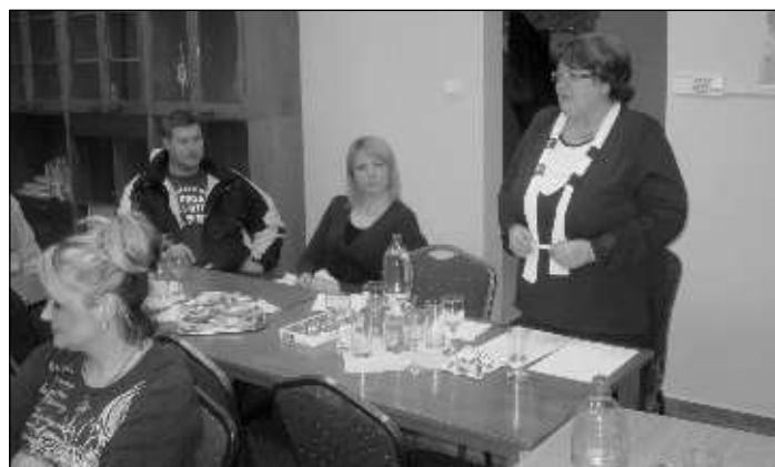
Delegátka okresného výboru ÚSČK v Nitre