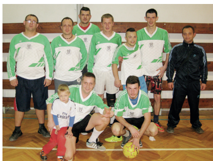
1. miesto - AC Triskáč