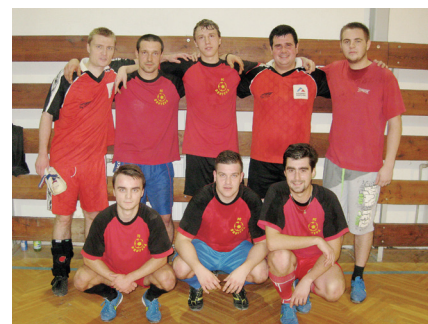
3. miesto - Druveva