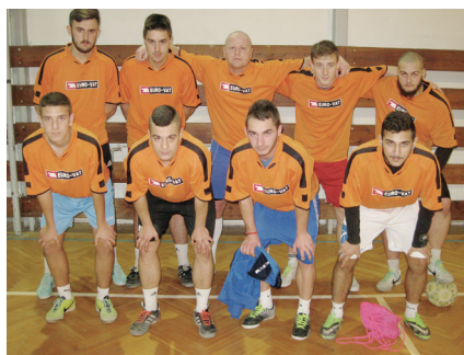
2. miesto - Galacticos