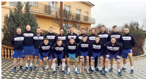
Foto zo sústreďenia v Radave