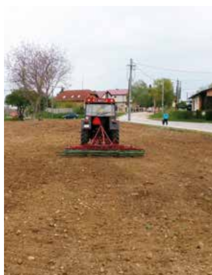
Revitalizácia verejného priestranstva na Železničnej ulici

kujú všetkým zúčastneným za pomoc. OcÚ Aleššince žiada občanov, aby nevynášali akýkoľvek odpad na verejné priestranstvá.