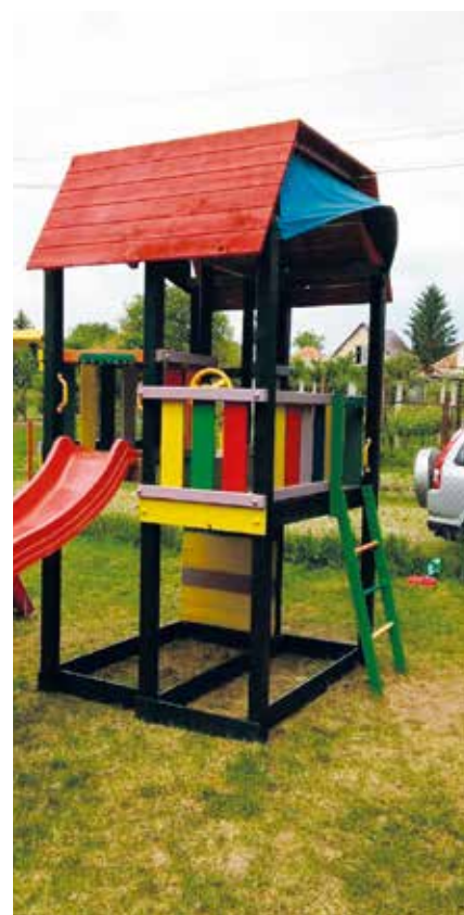
Natretie drevených častí detského ihriska

Poslednú májovú sobotu 28.5.2016 zorganizoval kolektív učiteliek materskej školy brigádu. Za pomoci rodičov natreli drevené časti detského ihriska farbou. Ďakujeme.