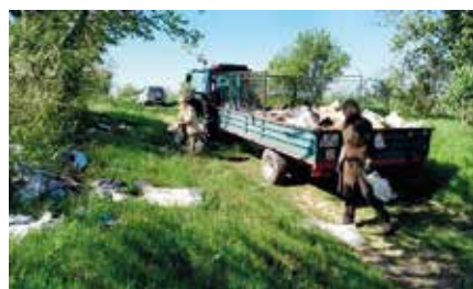
Vyčistenie niektorých úsekov poľných ciest

Starosta obce v spolupráci s Poľovním združením Aleššince zorganizoval brigádu, v rámci ktorej boli v katastrálnom území obce Aleššince vyčistené niektoré úseky poľných ciest. Touto cestou ďakujeme všetkým zúčastneným za odvedenú prácu.