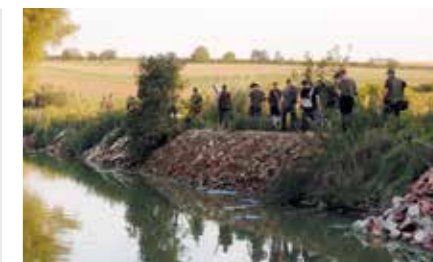
Rozostavovanie strelcov – poľovníkov na rybníkoch

Tak isto aj nám sa rozbieha hlavná poľovnícka sezóna, ktorú otvárame tradičnou spoločnou poľovačkou na kačicu divú na našich rybníkoch. Už aj tu možno konštatovať, že hlavným cieľom ani tak nie je samotný lov, ako stretnutie so svojimi kamarátmi a známymi, možnosť chvíľu sa zastaviť, po debatovať a zašpásovať. Je to spoločenská udalosť pri dobrom poľovníckom guláši a každému jednému z nás, ale hlavne našim priateľom sa veľmi ráta dobrá atmosféra