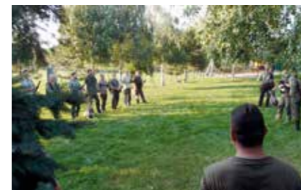
Nástup na 1. spoločnú poľovačku na kačicu v priestoroch Kynologického areálu

Môžeme len ticho závidieť geograficky vyššie položeným revírom, že si práve užívajú sviatok všetkých poľovníkov – jeleniu ruju – revačku. Ale nič to za to, aj náš revír nás vie očariť v každom ročnom období a prináša nás mnoho krásnych scenérií a zážitkov.