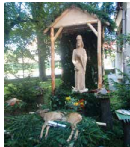
Nevyhnutnou súčasťou svätej omše sú obetné dary a socha patróna poľovníkov sv. Huberta

V nedeľu 18.9.2016 sme pripravovali v tomto období už možno povedať tradičnú Svätohuberskú svätú omšu v našom rímsko-katolíckom kostole.