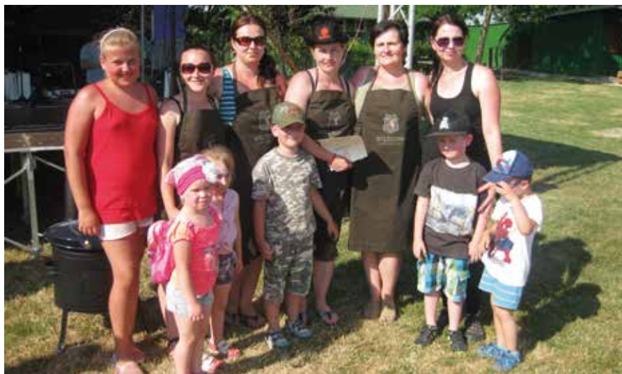
1. miesto: U hájnikovej ženy

Fotky z osláv nájdete na obecnej stránke v časti galéria.