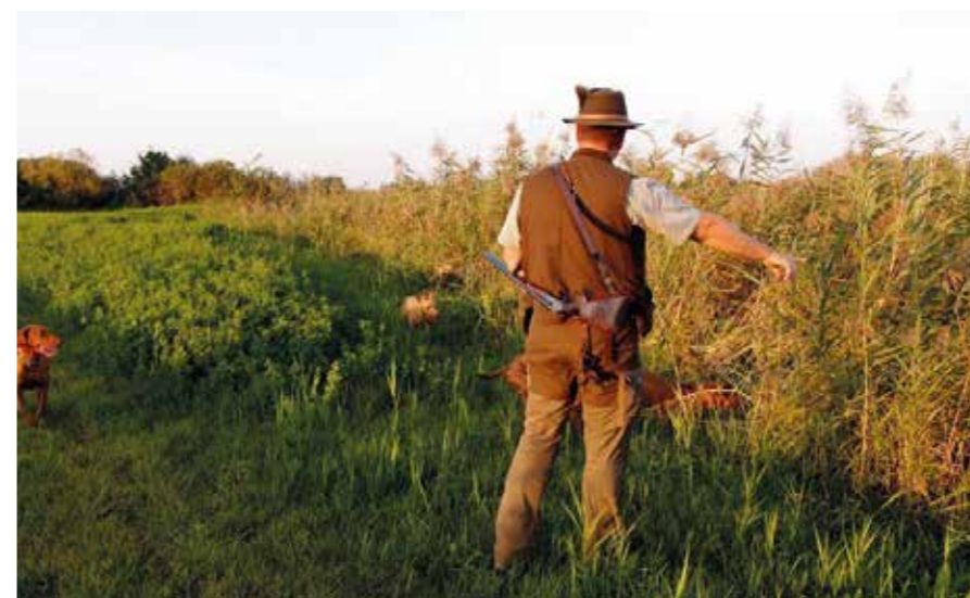
Bez našich štvornohých pomocníkov by sa len veľmi ťažko poľovalo, ako sa hovorí: „Poľovník bez psa, je ako človek bez ruky...“

Preto sa patrí aj touto formou vysloviť veľké poďakovanie všetkým domácim členom nášho poľovníckeho združenia za ich prácu v prospech vydareného priebehu tejto kynologickej akcie.