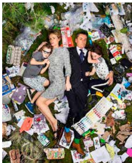
Fotograf Greg Segal zachytil vrámci svojho projektu odpad vyprodukovaný rodinou počas jedného týždňa.

Počuli ste už o pojme Zero Waste ? Je to spôsob života, pri ktorom sa vytvára nulový odpad. Pre mnohých z nás nepredstaviteľné, veď sa len obzrieme okolo seba. Odpad tvoríme neustále pri všetkých bežných činnostiach. Pri nákupe balíme rožky do jedného vrečka, rajčiny do druhého, banány do tretieho, atď. Objednáme si jedlo z donášky balené v polystyrénových obaloch, kupujeme oblečenie balené do igelitových tašiek, na „grilovačke“ použijeme jednorazové riady alebo pijeme kávu z plastových kapsúl. Porozhliadajme sa, čo všetko je balené do plastov. Skrátka, žijeme v dobe plastovej. Povieme si, no a čo? Moderná doba priniesla jednoduché a pohodlné riešenia a prečo