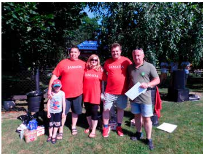
2. miesto: družstvo JAMADA