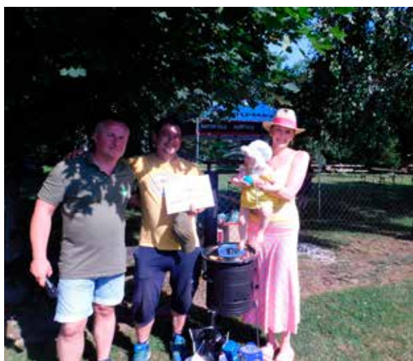
Cena za výzdobu stánku : VČELÁRI