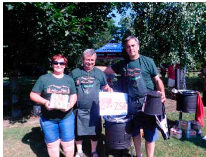
3. miesto : družstvo LÍŠČIA NORA