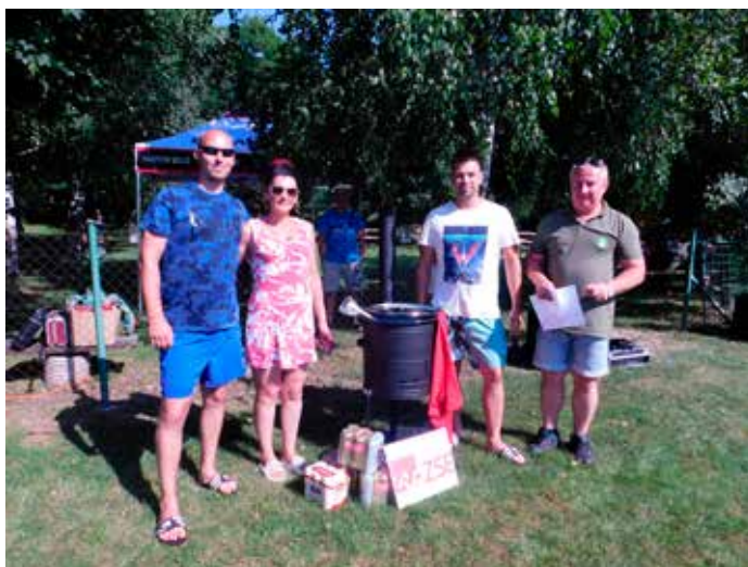
1. miesto: družstvo MAXI

Podujatie finančne podporila Nadácia ZSE a Nitriansky samosprávny kraj